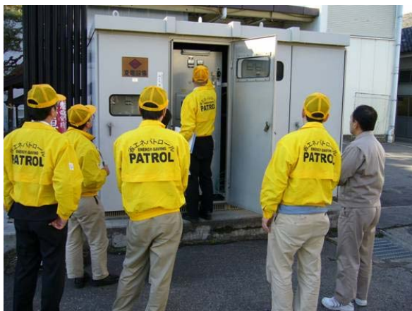
省エネパトロールの様子

日本電産サンキョーが派遣しているパトロール隊員2名も電機主任者などの専門的な資格を有しており、その専門知識や社内における実践経験をもとに県内各施設の管理者へわかりやすい説明を心がけて活動に励んでいます。