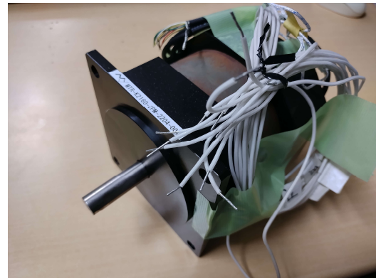
図3 試作した三相/六相モータ