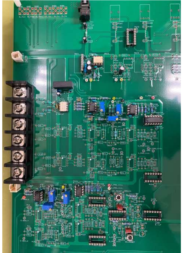
図 4 試作 3 レベルインバータ

実験装置による 3 レベルインバータの検討に関しては、図 4 に示す通りすでにその回路の試作に取り掛かっており、回路が完成次第、マトリックスコンバータの制御を導入して動作を確認していく予定である。ここで動作が問題なく行われたところで、様々なスイッチング周波数に対して回路中の各素子を重量、体積が小さくなるように選定していき、スイッチング周波数を変数とする効率と重量をパレートフロントカーブにて検討し、本研究で検討する重量と体積に密度を最適化していく。また、実験装置が完成後は、三相/六相モータの駆動試験を行い、特に電流の大きさとトルクを重点的に検討し、航空機に適した電力変換回路方式、および、発電方式を多方面から検討する予定である。