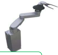
半導体ウェハー 搬送用ロボット