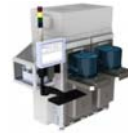
半導体ウェハー分別機 (EFEM)