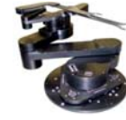
ウェハー搬送多関節ロボット (大気ロボット)