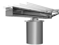
真空環境用ロボット